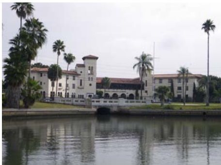
Il college è sulla baia Boca Ciega

La vacanza studio in Florida della St Giles ha come base la Admiral Farragut Academy nella città di St Petersburg; Tampa è a 30 minuti. La scuola si trova in un campus di 13 ettari di terreno, che si affaccia sul golfo di Messico. La città di Orlando, dove si trovano Walt Disney World, Sea World, Universal Studios e Adventure Island, si trova a soli 75 minuti. È prevista almeno una gita ad uno di questi parchi divertimenti ogni settimana.