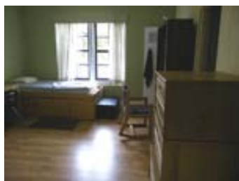
Una camera da letto