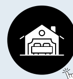
Self catering University Accommodation