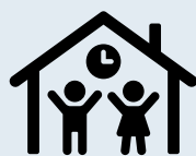
Children Under Five Years Old

Per spostarsi fuori città ci sono ottimi collegamenti con autobus di linea e treni per le zone costiere, altre città nel Kent, e con Londra.