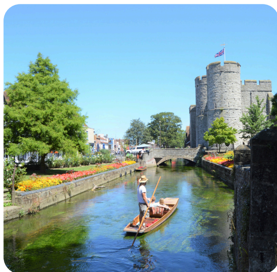
The River Stour and Westgate Gardens