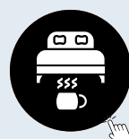
Local B&B Accommodation